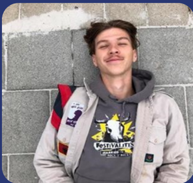
Bamboescheutgroene Vreedzame Steenbok -Nash