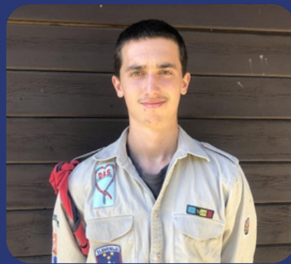
Vijgenpaarse Prudente Lijster -Vic