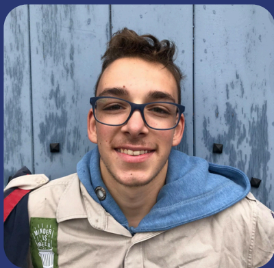
Zandbeige Gewillige Beermarker -Linga