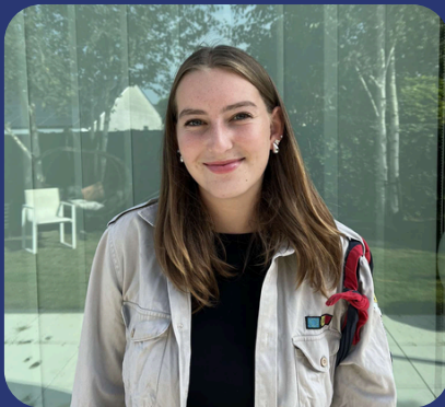
Granaatappelrode Serene Blauwe reiger -Orla